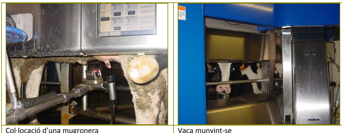
Col·locació d'una mugronera