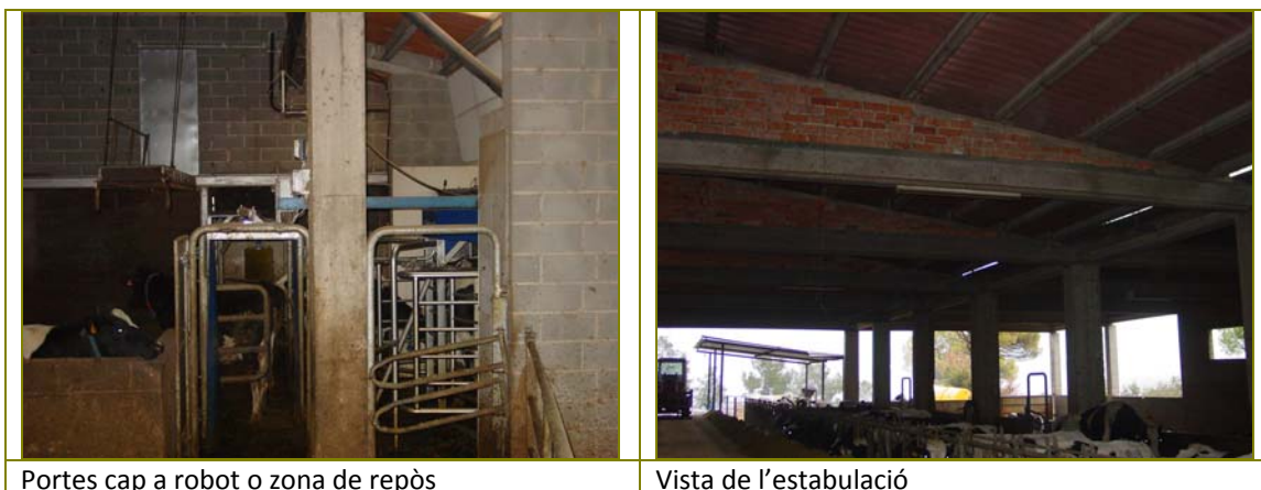
Portes cap a robot o zona de repòs