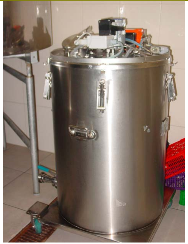
Dipòsit isotèrmic de 230 l per al dispensador de llet